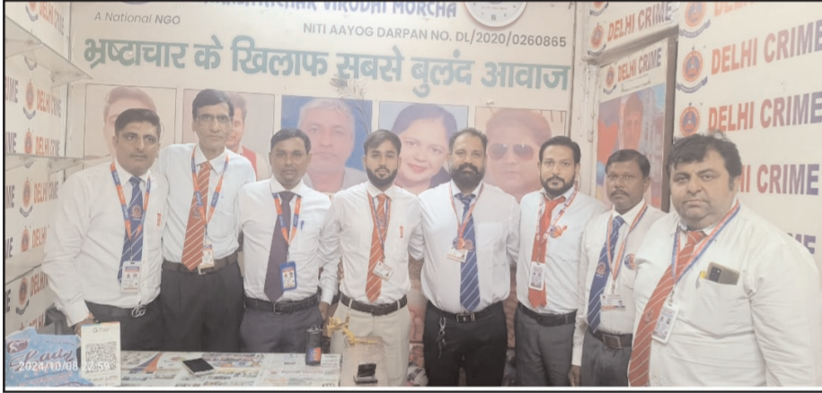
दिल्ली क्राइम के गुरुग्राम ब्रांच ऑफिस में शानदार लीडर मीटिंग सम्पन्न हुई।