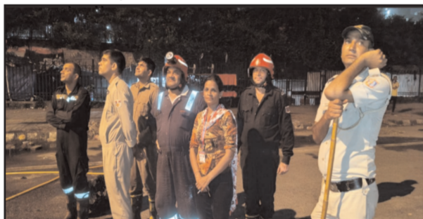
फायर ब्रिगेड कर्मियों का आग बुझाने में सहायता मिली।