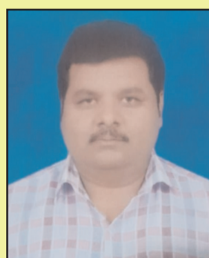
राजेन्द्र न्यूज सपोर्टर