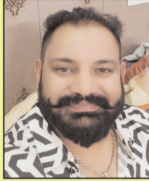
मोनु एरिया एडवाइजर