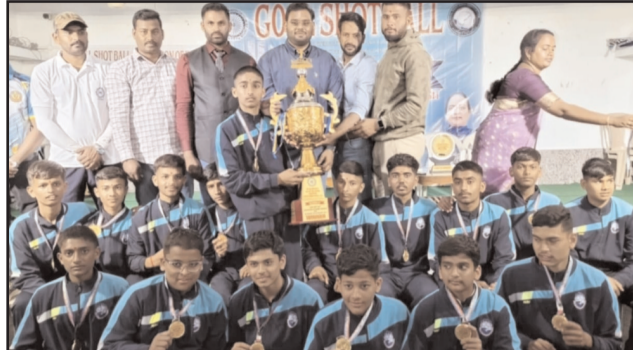
दहेगाव के खिलाड़ियों ने राष्ट्रीय प्रतियोगिता में जीता स्वर्ण पदक