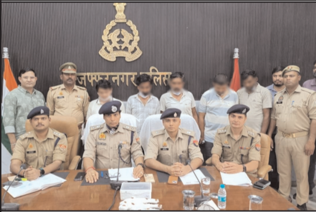
है। इस दौरान पुलिस की जवाबी फायरिंग में गिरोह के 2 तस्कर पैर में गोली लगने से घायल हो गए, जिन्हें उपचार के लिए अस्पताल भर्ती कराया गया है।