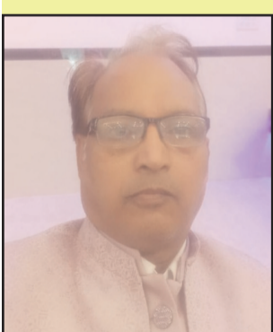
रवींद्र न्यूज सपोर्टर