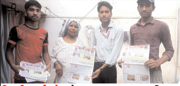
दिल्ली क्राइम प्रेस के जन जागरूकता अभियान में गांव और शहर के युवाओं की भागीदारी जारी