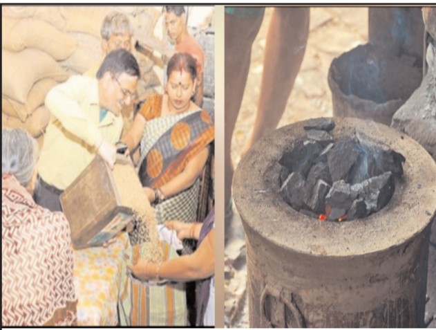
पटना: एलपीजी गैस की कमी से जूझ रहे लोगों को राहत देने के लिए बिहार सरकार ने बड़ा फैसला लिया है। अब राज्य में जन वितरण प्रणाली (PDS) की दुकानों के माध्यम से कुकिंग कोयला उपलब्ध कराया जाएगा।