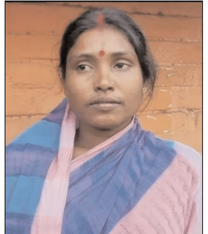
कालिता मांडी, औसग्राम 12500 वोट से विजयी