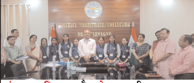
संस्कार, शिक्षा और नेतृत्व की पहचान— भागवती सरस्वती विद्या मंदिर इंटर कॉलेज की बेटियों ने मिशन शक्ति 5.0 में संभाली प्रशासनिक कमान