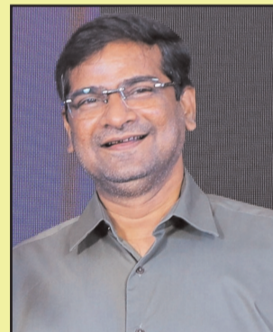
सी राजकुमार बागमार न्यूज सपोर्टर