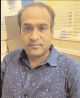
लेखक-सिद्धार्थ शंकर /ईएमएस

देश में कोरोना का डर फिर सताने लगा है। सबसे ज्यादा केस महाराष्ट्र और केरल से आ रहे हैं। महाराष्ट्र में 24 घंटे में 2701 नए केस मिले हैं, जो 17 फरवरी के बाद सबसे ज्यादा है। 17 फरवरी को 2,797 संक्रमित मिले थे। वहीं, मंगलवार (7 जून) को यहाँ 1821 मरीज पॉजिटिव पाए गए थे। इस तरह बुधवार को राज्य में 44 फीसदी मामले बढ़ गए। अकेले मुंबई में 1765 संक्रमित पाए गए, जो इस साल जनवरी के बाद सबसे ज्यादा है। पूरे महाराष्ट्र में पॉजिटिविटी रेट 6.48 फीसदी है। आईआईटी कानपुर ने जून में चौथी लहर आने