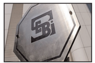
5,000 करोड़ रुपए से अधिक के

नई दिल्ली (ईएमएस)। बाजार नियामक सेबी ने रोज वैली होटल्स एंड एंटरटेनमेंट लिमिटेड और उसके तत्कालीन निदेशकों के बैंक खातों के साथ ही के शेयर और म्यूचुअल फंड होल्डिंग को कुर्क करने का आदेश दिया। सेबी ने निवेशकों के कुल