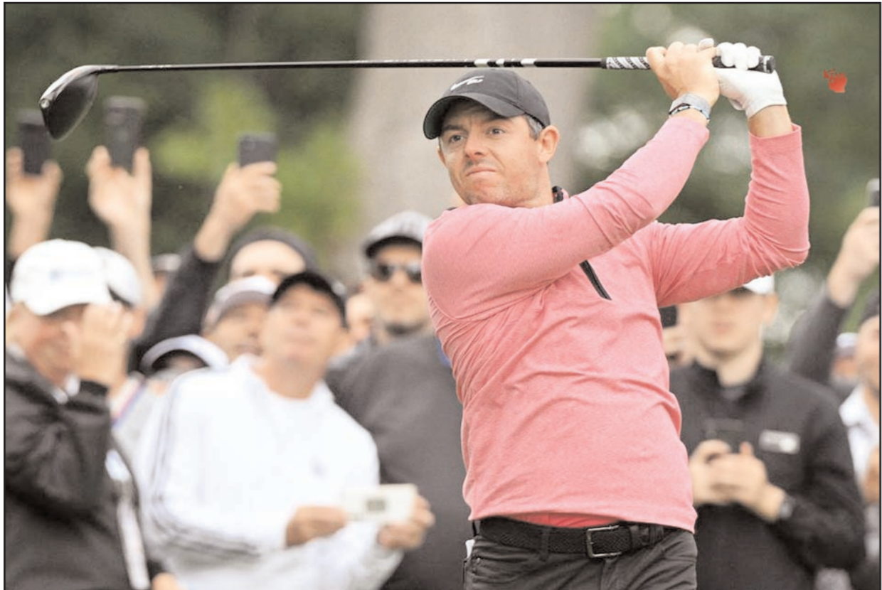
कनाडाई ओपन गोल्फ में खेलते हुए रॉरी मैकलरॉय।