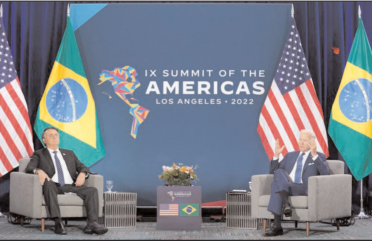
लॉस एंजिल्स में अमेरिकी राष्ट्रपति जो बाइडेन ब्राजील के राष्ट्रपति जेयर बोलसेनरो के साथ ही नौवे सम्मेलन को संबोधित करते हुए।

ग्रीनहाउस गैस उत्सर्जन से निपटने का तरीका वेलिंग्टन (इंएमएस)। इसानों की कई गतिविधियां पर्यावरण को नुकसान पहुंचाती हैं। इन्हें रोकने के लिए लगातार प्रयास हो रहे हैं। न्यूजीलैंड ने कृषि से होने वाले ग्रीनहाउस गैस उत्सर्जन से निपटने के लिए अनोखा कदम उठाया है। न्यूजीलैंड में एक ड्रॉप लॉ पेश किया गया है, जिसके तहत देश के किसानों से उनकी भेड़ या गाय के डकारने पर हर बार पैसे लिए जाएंगे। पर्यावरण मंत्रालय के मुताबिक मौसदा कानून के अस्तित्व में आने के बाद न्यूजीलैंड दुनिया का पहला देश होगा, जहां किसानों को अपने पशुओं के उत्सर्जन के लिए भुगतान करना होगा। 50 लाख की आबादी वाला न्यूजीलैंड एक बड़ा कृषि निर्यातक है, जहां 1 करोड़ मवेशी और 2.6 करोड़ भेड़ हैं। देश के कुल ग्रीनहाउस गैस उत्सर्जन का लगभग आधा कृषि से होता है, जिसमें मुख्य रूप से मीथेन शामिल है। सरकार और कृषि समुदाय के प्रतिनिधियों की ओर से तैयार किए गए ड्रॉप प्लान के अनुसार, किसानों को 2025 से अपने गैस उत्सर्जन के लिए भुगतान करना होगा। लंबी और छोटी फार्म गैस की कीमत अलग-अलग होगी लेकिन उनकी मात्रा की गणना एक ही तरीके से की जाएगी। जलवायु परिवर्तन मंत्री जेम्स शॉ ने कहा, इसमें कोई दो राय नहीं है कि हमें उस मीथेन की मात्रा को कम करना होगा जिसे हम वातावरण में झोक रहे हैं। इसमें एक प्रभावी उत्सर्जन मूल्य निर्धारण प्रणाली अहम भूमिका निभाएगी। दस्तावेज के अनुसार, ड्रॉप प्लान में किसानों के लिए उत्सर्जन को कम करने के लिए इन्सेटिव्स को शामिल किया गया है जिसकी भरपाई जंगल लगाकर की जा सकती है। इस स्कीम से आने वाले पैसे को किसानों के लिए रिसर्च, डेवलेपमेंट और एडवाइजरी सर्विसेज में निवेश किया जाएगा।