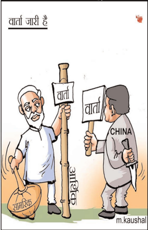
लेखक-सिद्धार्थ शंकर /ईएमएस