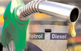
कम से क्रमशः 9.5 रुपए और सात रुपए तक गिर गए थे। अंतरराष्ट्रीय बाजार में लंदन ब्रेंट क्रूड रविवार 122.01 डॉलर प्रति बैरल और अमेरिकी क्रूड 0.86 प्रतिशत गिरकर 120.47 डॉलर प्रति बैरल पर है। देश के चार बड़े महागणों में रविवार को पेट्रोल और डीजल के दाम इस प्रकार रहे-दिल्ली पेट्रोल 96.72 रुपए प्रति लीटर, डीजल 89.62 रुपए प्रति लीटर, मुंबई पेट्रोल 111.35 रुपए प्रति लीटर, डीजल 97.28 रुपए प्रति लीटर, कोलकाता पेट्रोल 106.03 रुपए, प्रति लीटर, डीजल 92.76 रुपए प्रति लीटर और चेन्नई पेट्रोल 102.63 रुपए प्रति लीटर, डीजल 94.24 रुपए प्रति लीटर।

नई दिल्ली (ईएमएस)। देश में तेल निष्पन्न कंपनियों ने रविवार को पेट्रोल-डीजल की कीमतों में कोई बदलाव नहीं किया, जिससे लगातार 21वें दिन ईंधन के दाम स्थिर रहे। अंतरराष्ट्रीय बाजार में कच्चे तेल की कीमत 120 डॉलर प्रति बैरल के आगे चल रही है। इंडियन ऑयल की अधिसूचना के मुताबिक दिल्ली में रविवार को पेट्रोल का दाम 96.72 रुपए और डीजल का दाम 89.62 रुपए प्रति लीटर है, जबकि मुंबई में पेट्रोल और डीजल की कीमत क्रमशः 111.35 रुपए और 97.28 रुपए प्रति लीटर पर है। देश में पेट्रोल और डीजल की कीमतें मुख्य वर्धित कर (वैट) और माल दुलाई शुल्क के आधार पर राज्यों में अलग-अलग हैं। केंद्र सरकार ने 25 मई को आम आदमी को बड़ी राहत देते हुए पेट्रोल और डीजल पर उत्पाद शुल्क में क्रमशः आठ रुपए और छह रुपए प्रति लीटर की कटौती करने की घोषणा की थी। इससे पेट्रोल-डीजल के दाम