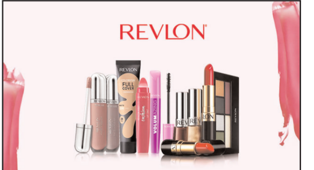
रहा है। मार्च में कंपनी ने कहा था कि उसे स्पलाई चेंज की दिक्कतों का सामना करना पड़ रहा है जिसके कारण वह मांग पूरा नहीं कर पा रही है। हालांकि पता चला था कि रेवलाॅन बैंकरप्सी के लिए आवेदन करने की योजना बना रही है। सूत्रों ने मुताबिक

मुंबई (ईएमएस)। कॉस्मेटिक्स बनाने वाली अमेरिका की मशहूर कंपनी रेवलाॅन इंक द्विवालिया होने के कारण पर पहुंच गई है। कंपनी अगले हफ्ते बैंकरप्सी के लिए आवेदन कर सकती है। कंपनी के शेयरों में पिछले दिनों 53 फीसदी गिरावट आई थी। लिपस्टिक बनाने वाली इस कंपनी ने अपने कारोबार को बचाने के लिए कर्जदारों से बात शुरू की थी। एक रिपोर्ट के मुताबिक मार्च के मध्य तक कंपनी पर 3.31 अरब डॉलर का कर्ज था। हाल के महिनों में सौदय प्रसाधनों की मांग में तेजी आई है क्योंकि लॉकडाउन की बंदियों समाप्त होने के बाद लोग बाहर निकल रहे हैं लेकिन रेवलाॅन को दूसरे ब्रैंड्स से कड़ी चुनौती का सामना करना पड़