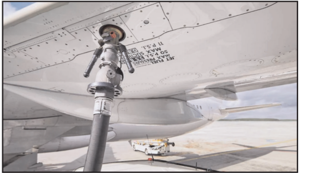
आनी शुरू हो गई है। कुछ रास्तों पर तो हवाई किराया 40 फीसदी तक महंगा हो गया है। दिलचस्प है कि एटीएफ के दाम रेकार्ड उच्च स्तर पर पहुंच चुके हैं। गौरतलब है कि एयरलाइन के खर्चों में एटीएफ करीब 40 फीसदी की हिस्सेदारी रखते हैं। जून के शुरूआती दिनों में 1.3 फीसदी की कटौती के बाद तेल

नई दिल्ली (ईएमएस)। पिछले दिनों में घरेलू हवाई किराया लगभग 20 फीसदी महंगा हो चुका है। अभी माना जा रहा है कि हवाई किराया आने वाले दिनों में हवाई किराया में और बढ़ोतरी होगी। यह सब इसलिए हो रहा है, क्योंकि एटीएफ की कीमतें काफी बढ़ चुकी हैं और अब एयरलाइन कंपनियां उससे निजात पाने की कोशिश कर रही हैं। एयरलाइन के एक अधिकारी के अनुसार एटीएफ की बढ़ती कीमतों के चलते किराया बढ़ाया जा रहा है और 15 जून तक फिर से बढ़ोतरी हो सकती है। हवाई यात्रा का किराया महंगा होने की वजह से मांग पर भी असर देखने को मिल रहा है। हवाई यात्रियों की संख्या धीरे-धीरे कोरोना काल से पहले के स्तर तक पहुंच रही थी, लेकिन जून में अचानक से इनकी संख्या में गिरावट