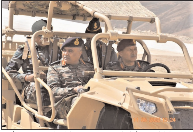
द्वारा मौजूदा सुरक्षा स्थिति के बारे में जानकारी दी गई। सीओएएस ने सैनिकों के साथ भी बातचीत की और उनकी दृढ़ता और उच्च मनोबल के लिए उनकी सराहना की। थल सेना प्रमुख को अग्रिम चौकियों के दौरे पर स्थानीय कमांडर सीमाओं पर मौजूदा स्थिति के बारे में

नई दिल्ली, (हि.स.)। सेना प्रमुख की कुर्सी संभालने के बाद पहली बार हिमाचल प्रदेश और उत्तराखंड से लगी चीन सीमा पर गए थल सेनाध्यक्ष जनरल मनोज पांडे ने शनिवार को अग्रिम चौकियों का दौरा किया। तीन दिवसीय दौरे के दूसरे दिन कमांडरों ने उन्हें मध्य क्षेत्र में वास्तविक नियंत्रण रेखा (एलएसी) की मौजूदा सुरक्षा स्थिति से अवगत कराया। सेना प्रमुख ने केंद्रीय क्षेत्र में शामिल हिमाचल प्रदेश और उत्तराखंड सीमा पर तैनात सैनिकों के साथ बातचीत करके उनकी दृढ़ता और उच्च मनोबल को सराहा। थल सेनाध्यक्ष जनरल मनोज पांडे वर्तमान में हिमाचल प्रदेश और उत्तराखंड राज्यों में वास्तविक नियंत्रण रेखा-एलएसी पर अग्रिम क्षेत्र के तीन दिवसीय दौरे पर हैं। भारतीय थल सेना प्रमुख का पदभार संभालने के बाद सेनाध्यक्ष का इस सेक्टर का यह पहला दौरा है। मध्य कमान के सेना कमांडर और उत्तर भारत क्षेत्र के जीओसी भी सेना प्रमुख के साथ इस दौरे पर हैं। भारतीय सेना ने एक ट्वीट में कहा कि सेना प्रमुख जनरल जनरल मनोज पांडे ने मध्य क्षेत्र के अग्रिम क्षेत्रों का दौरा किया और कमांडरों