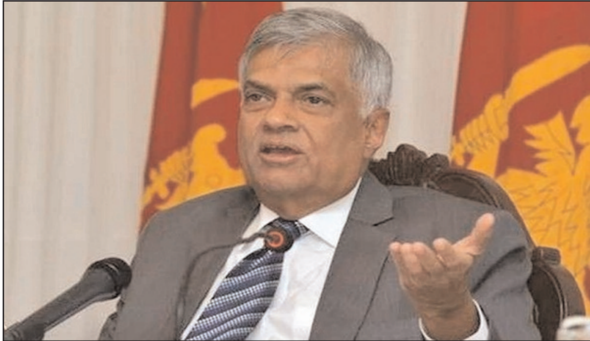
ने देश के आर्थिक संकट को सुलझाने के लिए विक्रमसिंघे की नियुक्ति की है। आर्थिक संकट की वजह से श्रीलंका का विदेशी मुद्रा भंडार लगभग खाली हो गया है। पिछले महिने देश में

कोलंबो (ईएमएस)। श्रीलंका को संभवतः रूस से अधिक कच्चा तेल खरीदने के लिए बाध्य होना पड़ सकता है। श्रीलंका के नवनीयुक्त प्रधानमंत्री रानिल विक्रमसिंघे ने यह बात कही है। असाधारण आर्थिक संकट के बीच यह द्वितीय देश इस समय गंभीर ईंधन संकट से जूझ रहा है। विक्रमसिंघे ने एक साक्षात्कार में कहा कि वह पहले अन्य स्रोतों से खरीद की संभावना तलाशेंगे, लेकिन रूस से अधिक कच्चा तेल खरीदने का विकल्प खुला है। उल्लेखनीय है कि यूक्रेन पर रूस के हमले के बाद ज्यादातर पश्चिमी देशों से रूसी ऊर्जा का आयात रोक दिया है। विक्रमसिंघे ने साक्षात्कार में कहा कि बढ़ते कर्ज के बोझ के बावजूद वह चीन से और वित्तीय मदद लेना चाहते हैं। उन्होंने कहा कि श्रीलंका की मौजूदा स्थिति उसकी खुद की वजह से है, लेकिन यूक्रेन युद्ध के कारण हालात और खराब हो गए हैं। उन्होंने कहा कि देश में खाद्य संकट 2024 तक बना रह सकता है। प्रधानमंत्री ने बताया कि रूस ने श्रीलंका को गैरू देने की भी पेशकश की है। विक्रमसिंघे के पास वित्त मंत्रालय की भी जिम्मेदारी है। उन्होंने यह साक्षात्कार राजधानी कोलंबो में अपने कार्यालय में दिया। उन्होंने छठी बार श्रीलंका के प्रधानमंत्री का पद संभाला है। राष्ट्रपति गोतबाया राजपक्षे