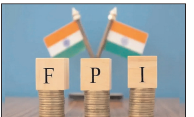
और 17,144 करोड़ रुपए निकाले थे। 24 फरवरी को रूस ने यूक्रेन पर आक्रमण किया था। इसके बाद मार्च में एफपीआई ने भारतीय बाजार से बड़ी मात्रा में पैसा निकाल लिया था। मार्च में विदेशी संस्थागत निवेशकों ने 41,243 करोड़ रुपए की निकासी की थी। इसके बाद विश्व भर में कई चीजों के दाम बढ़े व स्पलाई चेंज में बाधाएं आई और नतीजतन वैश्विक बाजार पूरी तरह से दबाव में दिखने लगे। भारतीय शेयर बाजार भी इससे अछूता नहीं

मुंबई (ईएमएस)। विदेशी संस्थागत निवेशक (एफपीआई) लगातार भारतीय शेयर बाजारों से पैसा निकासी कर रहे हैं। इससे घरेलू शेयर बाजार में गिरावट रकने का नाम नहीं ले रही है। किसी दिन अगर बाजार में खरीदारी नजर आती भी है तो फिर अगले कई दिन बिकवाली के बाद बाजार पहले से और नीचे चला जाता है। एफपीआई 2022 में अभी तक घरेलू शेयर बाजार से 1.81 लाख करोड़ रुपए निकाल चुके हैं। ऐसे में सवाल उठता है कि आखिर कब एफपीआई की बिकवाली रुकेगी और बाजार संतुल्य। कुछ जानकारों का मानना है कि इसे लेकर कुछ सरकारात्मक संकेत मिल सकते हैं। गौरतलब है कि जून में भी एफपीआई की बिकवाली जारी है। एनएसडीएल पर लागू नए ऑफरों के अनुसार जून में एफपीआई अभी तक 13,888 करोड़ रुपए भारतीय बाजार से निकाल चुके हैं। इससे पहले दो महिनों अप्रैल और मई में एफपीआई ने बाजार से क्रमशः 39,993 करोड़