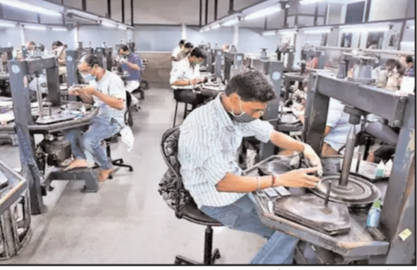
राज्य की हीरा इकाइयों ने अपने श्रमिकों और पॉलिश करने वालों के काम के घंटों में कटौती की है जिससे उनकी आजीविका प्रभावित हुई है। बड़े आकार के हीरों का प्रसंस्करण मुख्य रूप से राज्य के सूरत शहर की इकाइयों में किया जाता है। अमेरिका को भारत से 70 प्रतिशत कटे और पॉलिश हीरों का निर्यात किया जाता है। उसने रूसी कंपनियों पर प्रतिबंध

अहमदाबाद (ईएमएस)। रूस और यूक्रेन युद्ध की वजह से गुजरात का हीरा कारोबार काफी प्रभावित हुआ है। युद्ध के कारण इस उद्योग में कार्यरत लाखों श्रमिकों की नौकरी खतरे में पड़ गई है। विशेषरूप से सौराष्ट्र क्षेत्र के ग्रामीण हिस्से में कार्यरत इकाइयां इस घटनाक्रम से सबसे अधिक प्रभावित हुई हैं। उद्योग के प्रतिनिधियों ने बताया कि ये इकाइयां प्रसंस्करण और पॉलिश करने के लिए रूस से छोटी मात्रा में हीरों का आयात करती हैं। रब एवं आभूषण निर्यात संवर्धन परिषद ने कहा कि राज्य के हीरा उद्योग में करीब 15 लाख लोगों को रोजगार मिला हुआ है। रूस से छोटे आकार के कच्चे हीरों की आपूर्ति में कमी के कारण गुजरात के व्यापारी अफ्रीकी देशों और अन्य जगहों से कच्चा माल खरीदने को मजबूर हैं, जिससे उनका मुनाफा प्रभावित हो रहा है। इसलिए