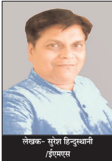
लेखक- सुरेश हिन्दुस्थानी /ईएमएस