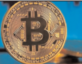
ने इसके लिए एक पैनाल बनाया है। इसमें अधिकारियों, जानकारों, वकीलों, डिजिटल एक्सचेंज और एनजीओ के प्रतिनिधियों को शामिल किया गया है। सरकार को ऐसे हजारों लोगों की तरफ से ज्ञापन मिला है जिन्होंने क्रिप्टोकॉर्सीज में अपना निवेश गंवाया है। एफओव्यू से उपभोक्ताओं को क्रिप्टोकॉर्सीज के बारे में अपनी समझ बढ़ाने का मौका मिलेगा। इससे वे इनमें निवेश करते समय सावधानी बरत सकेंगे।

नई दिल्ली (ईएमएस)। दुनियाभर में हाल के वर्षों में बिटकॉइन जैसी क्रिप्टोकॉर्सीज की लोकप्रियता बढ़ी है। सूत्रों की मानें तो देश में करोड़ों लोगों ने क्रिप्टोकॉर्सीज में निवेश किया है। इसमें युवाओं से लेकर सीनियर सिटीजंस भी शामिल हैं लेकिन क्रिप्टोकॉर्सीज पर अब तक देश में कोई कानून नहीं है। इस कारण लोगों में भ्रम की स्थिति है। इसे दूर करने के लिए सरकार जल्दी ही एक दस्तावेज जारी करने जा रही है। इसमें क्रिप्टोकॉर्सीज के बारे में अक्सर पूछे जाने वाले सवालों का विस्तार से जवाब दिया जाएगा। साथ ही निवेशकों को किस स्टडी के बारे में भी बताया जाएगा ताकि लोगों को डिजिटल करेंसीज से जुड़े जोखिमों के बारे में बताया जा सके। मंत्रालय