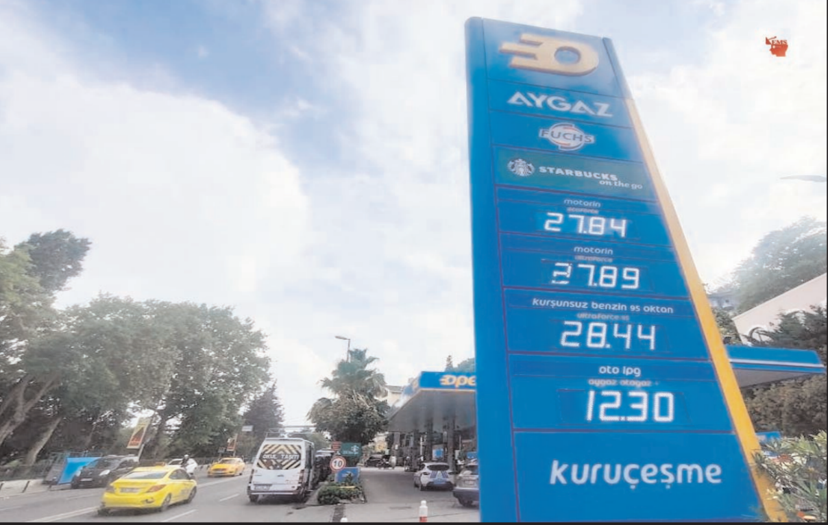
तुर्की के एक गैस स्टेशन में कीमतें बढ़ने के बाद बोर्ड पर लिखी हुई नई कीमतें।

राष्ट्रपति शी जिनिपिंग ने कोरोना से पार पाने के लिए जीरो कोविड पॉलिसी को और कड़ाई से पालन करने का आदेश दिया है। अधिकारियों का कहना है कि बुजुर्गों और मेडिकल सिस्टम को बचाने की आवश्यकता है। अब तक यहाँ 1.4 बिलियन के देश में कुल 5,226 मौतें हुई हैं। राजधानी बीजिंग में शनिवार दोपहर 3 बजे तक 46 नए मामले दर्ज किए गए। स्वास्थ्य अधिकारी लियू शियाओफेंग ने बताया कि सभी मामलों को निगरानी में रखा गया है। इसके साथ ही शहर ने नए प्रतिबंधों की घोषणा नहीं की गई है। अब तक बार में जाने वाले 115 लोग कोरोना की चपेट में आ चुके हैं। जबकि 6,158 ऐसे लोग हैं जो बार जाने वालों की संपर्क में आए हैं। उधर शंघाई में भी कोरोना ने एक बार फिर से चिंता बढ़ा दी है। सरकार ने यहाँ के लगभग 25 मिलियन लोगों के कोविड-19 टेस्ट का एक ऐलान किया है।