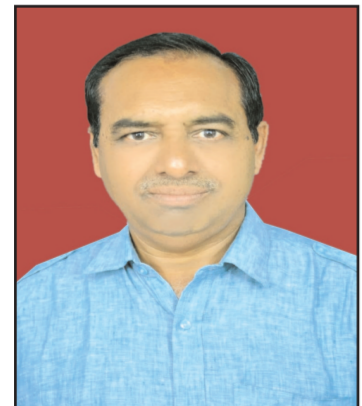
लेखक- रमेश सर्राफ धर्मोरा (ईएमएस)

राज्यसभा के चुनाव में एक बार फिर राज्यसभा के मुख्यमंत्री अशोक गहलोट की जादूगरी देखने को मिली। गहलोट ने भाजपा के संसदों पर पानी फेरते हुए आसानी से कांग्रेस के तीनों उम्मीदवारों रणदीप सुरजेवाला, मुकुल वासनिक और प्रमोद तिवारी को जितवा कर कांग्रेस आलाकमान की नजरों में अपनी राजनीति का लोहा मनवाया है। इस बार के राज्यसभा चुनाव में गहलोट ने कांग्रेस के 108 विधायकों के साथ ही निर्दलीय व अन्य दलों के सभी विधायकों को एकजुट कर यह संभव कर दिखाया। राजस्थान में राज्यसभा के लिए चार सीटों के चुनाव हुए। यह चारों सीट पूर्व में