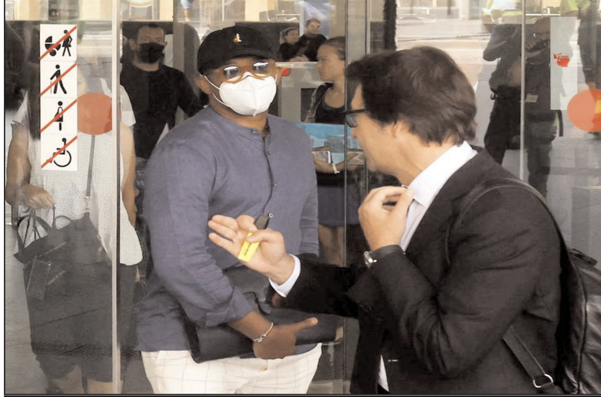
स्पेन में टेक्स चोरी के मामले में पूर्व खिलाड़ी सैमुअल डटो अदालत में पेश हुए।

2017-18 सत्र में जमशेदपुर के खिलाफ पदार्पण किया। पुणे सिटी एफसी में दो साल बिताते के बाद, 23 वर्षीय विंगर 2019-2020 सीजन में बेंगलुरु एफसी चले गए। उन्होंने अब तक कुल 39 मैचों के साथ क्लब के साथ एक प्रभावशाली कार्यकाल पूरा किया। आशिक, ने हाल ही में 2023 एफसी एशियाई कप के लिए भारतीय राष्ट्रीय टीम को बवालौफार्ड करने में महत्वपूर्ण भूमिका निभाई है। समय के साथ वह राष्ट्रीय टीम में मुख्य आधार बनते जा रहा है और वह कोच इंगोर रिट्मैक की भाविक्य की योजनाओं का हिस्सा है।