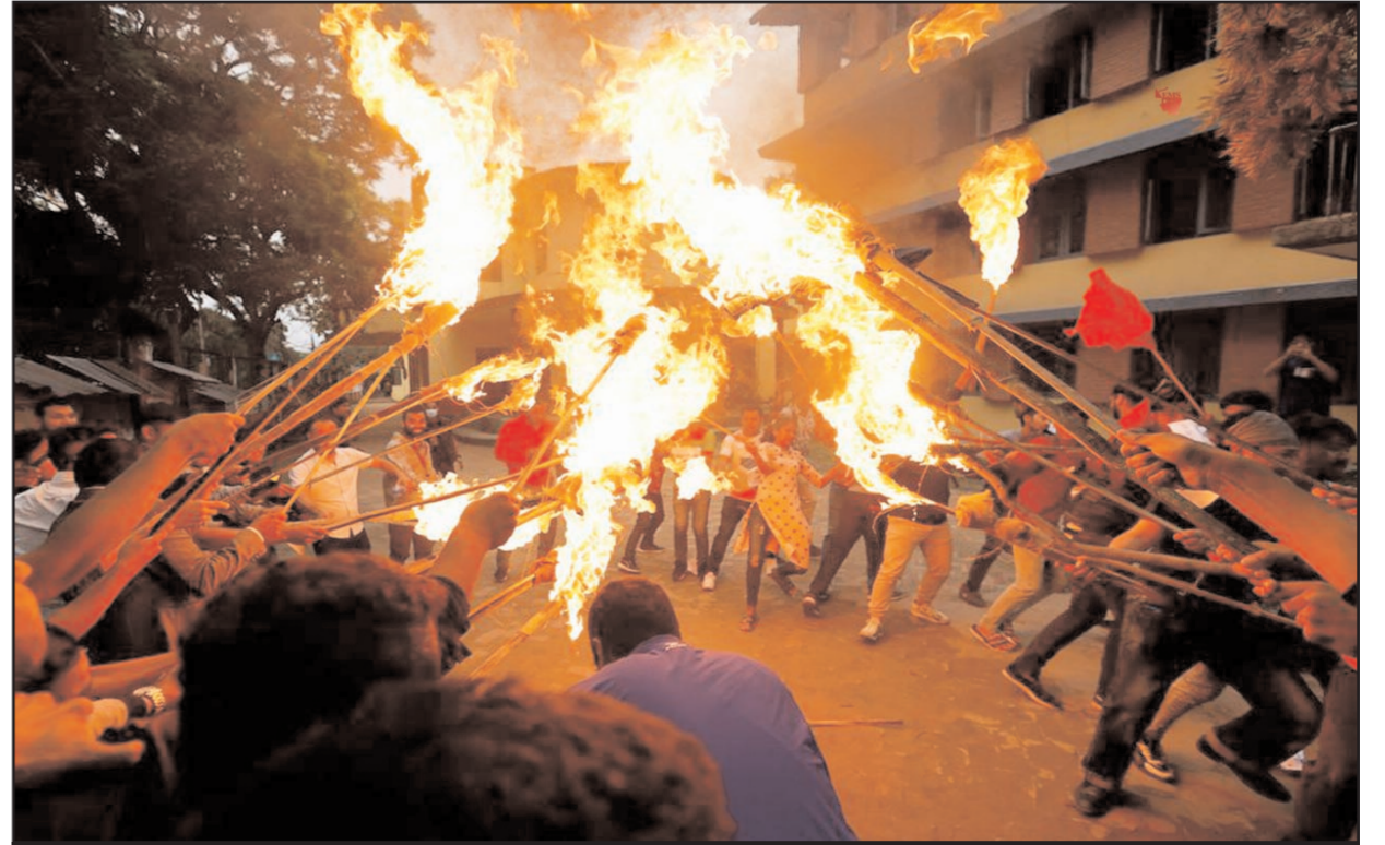
काठमांडू में टोच रैली निकालकर इंधन की कीमतें बढ़ने का विरोध करते हुए लोग।

शंघाई (ईएमएस) । प्यार में जीने-मरने की कसमें खाने वाले प्रेमी-प्रेमिका में अनबन के बाद ब्रेकअप के किस्से आम हैं लेकिन चीन के शंघाई में रहने वाले एक युवक जो किया उसे सुनकर आप हैरान हो जाएंगे। इस युवक की गर्लफ्रेंड ने जैसे ही उससे रिश्ता तोड़ा तो उसने बाकायदा ब्रेकअप लॉग बनाकर उस पर खर्च की गई पाई-पाई वापस मांग ली। उसके खर्च का ब्रेक अप लॉग इस वक चीन के सोशल मीडिया पर जबरदस्त पॉपुलैरिटी हासिल कर रहा है। इस लॉग लिस्ट में पानी की बोतल से लेकर चिप्स और बाकी स्नैक्स का भी हिसाब-किताब लिखा गया है। जैसे मामला कुछ भी हो, लेकिन लड़के की याददाश्त और क्रिएटिविटी तो माननी ही पड़ेगी। चाइनीज मीडिया रिपोर्ट्स के मुताबिक मामला शंघाई का है। लड़का यहाँ का रहने वाला है और वो एक लड़की को सालभर से डेट कर रहा था। जब उन दोनों का रिश्ता टूटने के कगार पर पहुंचा तो लड़के ने मजेदार स्टेप उठाया। उसने कुल 3 पेज में डेटिंग के दौरान खर्च की गई एक-एक पाई का कम्प्यूटराइज्ड लॉग तैयार किया। ये लॉग रिलेशनशिप के दौरान हर दिन खर्च किए गए पैसे का हिसाब था। चीन के सोशल मीडिया पर लड़के की ये डिटेल्ड ब्रेक अप लिस्ट जमकर वायरल हो रही है। कुछ लोग उसकी हरकत को सही नहीं मान रहे हैं तो वहीं बहुत से लोगों उसकी याददाश्त की भरपूर तारीफ की है। शख्स ने जो लिस्ट बनाई है, उसमें छोटे-मोटे खर्च भी लिखे गए हैं। इसमें 2 पानी की बोतलें और स्नैक्स पर किया गया खर्च भी मंशन है। जो स्नैक्स लड़की ने अकेले खोए उसे भी लिखा गया है और कपल एक्सपेंडिचर भी लिखे हैं। डिनर और लंच के खर्च को आधा कर दिया गया है। लड़की की मां के बीमार होने पर हॉस्पिटलइजेशन का खर्च और उनकी मौत के बाद अंतिम संस्कार में मदद के तौर पर दिया गया खर्च भी लिस्ट में मंशन है।