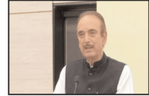
गहलोट सहित उनकी पार्टी के अनेक सहयोगियों ने उनके शीघ्र स्वस्थ होने की कामना की है।

नई दिल्ली, (हि.स.)। जम्मू-कश्मीर के पूर्व मुख्यमंत्री और कांग्रेस के वरिष्ठ नेता गुलाम नबी आजाद कोरोना संक्रमित हो गए हैं। गुलाम नबी आजाद ने मंगलवार को ट्वीट कर बताया कि आज उनकी कोविड जांच रिपोर्ट पॉजिटिव आई है। डॉक्टरों ने उन्हें होम क्वारंटाइन की सलाह दी है। राजस्थान के मुख्यमंत्री अशोक