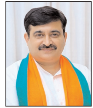
मंगलवार को कहा कि अंतरराष्ट्रीय योग दिवस के अवसर पर मुख्यमंत्री