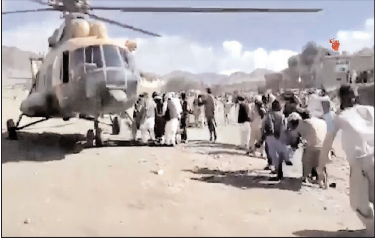
अफगानिस्तान में आये भीषण भूकंप के बाद घायलों को एक हेलीकाप्टर तक पहुंचाते हुए लोग।

कोविड किस तरह से हमारे मस्तिष्क पर असर डाल सकता है, इस जानना इस मायने में महत्वपूर्ण है कि हम इसी से इस बीमारी से निपटने की तैयारी कर लें। स्टडी में कहा गया है कि कोरोना चूहों के मस्तिष्क के नर्स सेल को उन टॉक्सिन के प्रति संवेदनीशील बना देता है जिसे पार्किंसन की बीमारी के लिए जिम्मेदार माना जाता है और जिससे दिमाग की कोशिकाओं को नुकसान पहुंचता है। शोधकर्ताओं ने पाया कि 2009 की फ्लू महामारी के कारण एच1एन1 एनफ्लुएंजा स्ट्रेन के संपर्क में आने वाले चूहे एमपीटीपी के प्रति अधिक संवेदनशील थे। एमपीटीपी एक टॉक्सिन है, जो पार्किंसन के विशिष्ट लक्षणों का कारण बनता है। पार्किंसन बीमारी दूसरा सबसे आम न्यूरोडिजेनेरेटिव डिसऑर्डर है। यह एक ऐसी बीमारी है जो मनुष्य के उस हिस्से को प्रभावित करती है जो हमारे शरीर के अंगों को संचालित करता है। इसके लक्षण इतने कम होते हैं कि शुरुआत में आप इस पहचान नहीं कर सकते हैं।