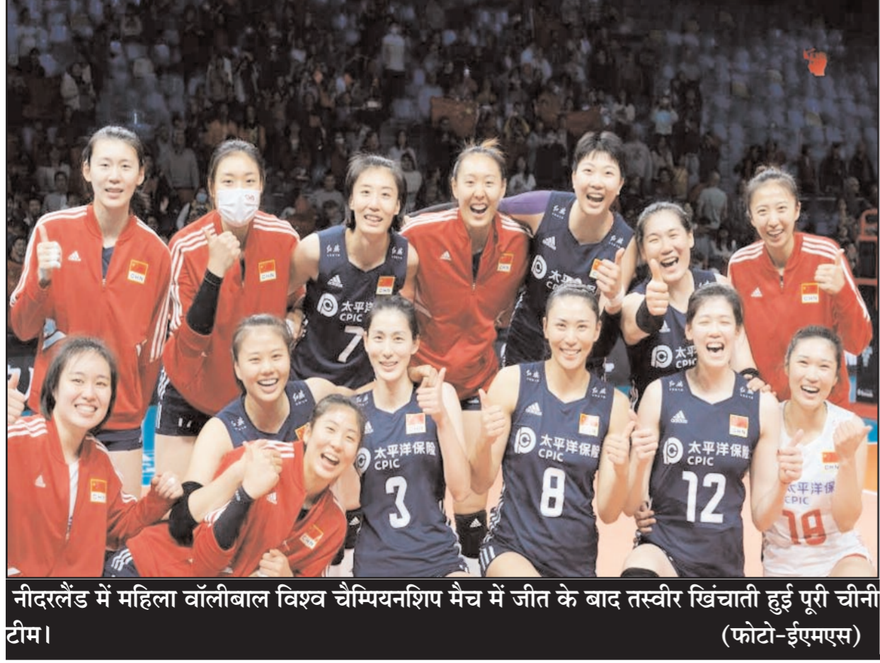
नीदरलैंड में महिला वॉलीबाल विश्व चैम्पियनशिप मैच में जीत के बाद तस्वीर खिंचाती हुई पूरी चीनी टीम।

एससीजी में अपने टी 20 विश्व कप अभियान की शुरुआत करेगी। टूर्नामेंट के 2021 संस्करण में न्यूजीलैंड को ऑस्ट्रेलिया के हाथों हार का सामना करना पड़ा था। आईसीसी टी-20 विश्व कप के लिए न्यूजीलैंड की टीम इस प्रकार है: केन विलियमसन (कप्तान), फिन एलन, ट्रेट बोल्ट, माइकल ब्रेसवेल, मार्क चैपमैन, डेवोन कॉनवे (विकेटकीपर), लॉकी फर्ग्यूसन, मार्टिन गप्टिल, एडम मिलने, डेरिल मिशेल, जिमी नीशम, ग्लेन फिलिप्स, मिशेल सेंटनर, ईश सोढ़ी, टिम साउथी।