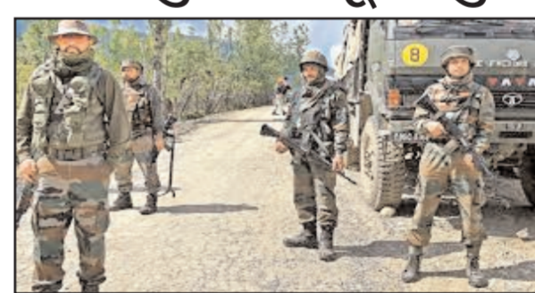
अक्टूबर को जम्मू कश्मीर के दौरे पर आएंगे। पूर्व निर्धारित एक व दो अक्टूबर को होने वाली रैलियां अब चार व पांच अक्टूबर को होंगी। इससे पहले ही ऊधमपुर में 08 घंटों के भीतर दो बम धमाके

हलांकि इस दौरान कोई भी संदिग्ध वस्तु बरामद नहीं हुई। जम्मू शहर में नाकों को सख्त करने के साथ पुलिस कमियों को भीडभाड़ वाले बाजारों में गश्त करने को कहा गया है ताकि संदिग्धों पर नजर रखी जा सके। जम्मू पुलिस की सीआईडी विंग के जवान भी सादी वर्दी में तैनात हैं। इसी बीच नागरिक सचिवालय, उपा राज्यपाल आवास, सुरक्षा बलों के शिविर, पुलिस मुख्यालय जैसे संवेदनशील स्थलों पर सुरक्षा के लिए तैनात जवानों को सतर्क रहने को कहा गया है।