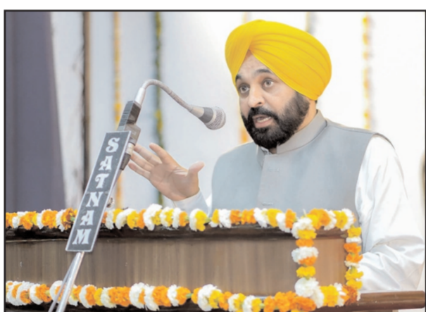
मुख्यमंत्री ने कहा, हम सभी को संकल्प लेना चाहिए कि हम अच्छे मौकों की तलाश में पलायन करने के बजाय यहां रहकर व्यवस्था में सुधार करेंगे। उन्होंने यह भी कहा कि सरकार पंजाब की पुरानी प्रतिष्ठा बहाल करने के लिए प्रतिबद्ध है।

चंडीगढ़। पंजाब में सत्तारूढ़ आप पार्टी के मुख्यमंत्री भगवंत मान ने ऐलान किया कि गुरुनानक देव विश्वविद्यालय में शहीद भगत सिंह के नाम पर एक पीठ की स्थापना की जाएगी। मान भगत सिंह की 115वीं जयंती के मौके पर राज्य स्तरीय कार्यक्रम को संबोधित कर रहे थे। शहीद भगत सिंह (एसबीएस) नगर जिले में खटकड़ कलां स्वतंत्रता सेनानी का पुश्तैनी गांव है। जिले का नाम उनके ही नाम पर रखा गया है। मान ने कहा कि पीठ शहीद भगत सिंह की जिंदगी और दर्शन पर व्यापक शोध करेगी। उन्होंने कहा कि यह कदम आने वाली पीढ़ियों को देश की सेवा करने के लिए प्रेरित करने में मदद करेगा। मान ने शहीद भगत सिंह युवा पुरस्कार को फिर से शुरू करने की भी घोषणा की। एक विज्ञापित के मुताबिक, उन्होंने कहा कि यह पुरस्कार अलग अलग क्षेत्रों में उत्कृष्ट योगदान के लिए हर साल 46 युवाओं को दिया जाएगा। मान ने लोगों से यह प्रण लेने का भी आह्वान किया कि वे अच्छे मौकों की तलाश में देश नहीं छोड़ेंगे।