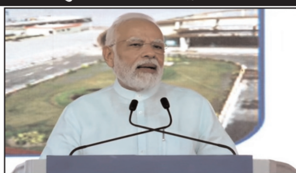
प्रधानमंत्री ने कहा कि इस सदी के शुरूआती दशकों में जब दुनिया में 3-पी यानि सरकारी निजी कंपनी भागीदारी (पब्लिक प्राइवेट

सूरत/नई दिल्ली। प्रधानमंत्री नरेन्द्र मोदी ने गुरुवार को सूरत में 3400 करोड़ रुपये से अधिक की विभिन्न विकास परियोजनाओं का रिमोट का बटन दबाकर शिलान्यास और लोकार्पण किया। इस मौके पर प्रधानमंत्री ने जनसभा को संबोधित करते हुए कहा कि गुजरात का सूरत शहर जनभागीदारी और एकजुटता का एक बेहतरीन उदाहरण है। उन्होंने कहा कि पूरे भारत के लोग सूरत में रहते हैं, यह एक छोटा भारत है। सूरत की सबसे बड़ी खासियत ये है कि ये शहर श्रम का सम्मान करने वाला शहर है। उन्होंने आगे कहा कि यह शहर जीवन में प्रगति की आकांक्षाओं को पूरा करता है।