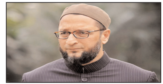
जिए। सांसद ओवैसी ने सवाल किया कि पीएफआई पर प्रतिबंध लगाया है, लेकिन खाजा अजमेरी बम धमाकों में लिफ्त संगठनों पर प्रतिबंध क्यों नहीं लगाया जा रहा है? सरकार ने दक्षिणपंथी संगठनों पर प्रतिबंध क्यों नहीं लगाया? ओवैसी ने कहा कि इस तरह का कठोर प्रतिबंध खतरनाक है, क्योंकि यह किसी भी मुसलमान पर रोक लगाता है जो अपने मन की बात कहना चाहता है।

हैदराबाद। ऑल इंडिया मजलिस-ए-इतेहादुल मुस्लिमीन के प्रमुख एवं हैदराबाद के सांसद असदुद्दीन ओवैसी ने गुरुवार को कहा कि उन्होंने पापुलर फ्रंट ऑफ इंडिया (पीएफआई) के कट्टरपंथी दृष्टिकोण का हमेशा विरोध किया है, लेकिन उस पर प्रतिबंध का समर्थन नहीं किया जा सकता। केंद्र सरकार द्वारा पीएफआई पर पांच साल के लिए लगाए गए प्रतिबंध के फैसले के एक दिन बाद ओवैसी ने एक बयान में कहा कि उन्होंने पीएफआई के कट्टरपंथी दृष्टिकोण का हमेशा विरोध किया है, लेकिन पीएफआई पर इस प्रतिबंध का समर्थन नहीं किया जा सकता क्योंकि संगठन के कुछ व्यक्तियों द्वारा किये गये अपराध का यह मतलब नहीं है कि पूरे संगठन को ही प्रतिबंधित कर