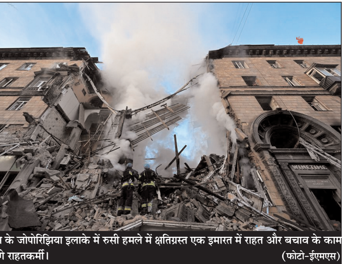
यूक्रेन के जोपोरिझिया इलाके में रूसी हमले में क्षतिग्रस्त एक इमारत में राहत और बचाव के काम में लगे राहतकर्मी।

में नगरीय सरकारों द्वारा हिंसक अपराधों पर काबू पाने के लिए कर्फ्यू लगाने का प्रावधान किया जाता है। 2020 के बाद से बड़ी तेजी से अमेरिका में अपराध बढ़ रहे हैं। स्थानीय पुलिस अधिसूचना के अनुसार बच्चों और युवाओं के रात में 10 बजे के बाद निकलने पर उन्हें पकड़ती है। बच्चों और युवाओं को उनके घर छोड़कर आती है, उनकी माता-पिता से जुर्माना वसूल करती है।