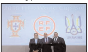
स्पेनिश फुटबाल महासंघ और पुर्तगाली फुटबाल महासंघ ने 2030 विश्व कप के आयोजन के लिए यूक्रेनी फुटबाल संघ को इबेरियन बोली में शामिल किया।

मैड्रिड/कीव, (हि.स.)। वर्ष 2030 विश्व कप की मेजबानी स्पेन और पुर्तगाल के साथ युद्धग्रस्त यूक्रेन भी करेगा। यह तीनों देशों के फुटबाल संघ के अध्यक्षों ने फैसला लिया है। स्पेनिश फुटबाल संघ (आरएफईएफ) के अध्यक्ष लुइस रबियल्स ने कहा कि संस्थागत मुख्यालय मैड्रिड में है, प्रशासनिक मुख्यालय लिस्बन