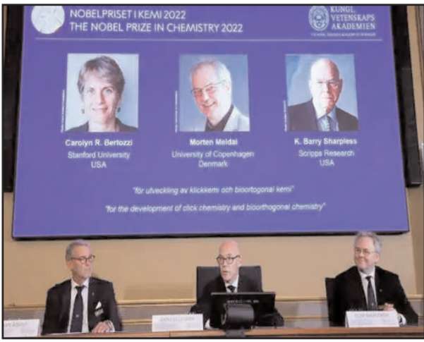
नोबेल पुरस्कार 2022 के विजेता: कार्लिन ए. बर्टोजी, मोर्टन मेल्टल, और के. बर्री शार्पलेस।

स्टॉकहोम, 6 अक्टूबर (हि.स.)। शाही स्वीडिश विज्ञान अकादमी ने अमेरिका की कैरोलिन आर बटोजी व के वैरी शार्पलेस और डेनमार्क के मोर्टन मेल्डल को क्लिक केमिस्ट्री और बायोऑर्थोगोनल केमिस्ट्री के विकास के लिए संयुक्त रूप से रसायन विज्ञान में 2022 का नोबेल पुरस्कार देने की घोषणा की है। बुधवार को शाही स्वीडिश विज्ञान अकादमी ने बताया कि शार्पलेस और मेल्डल ने क्लिक केमिस्ट्री के रूप में रसायन विज्ञान के एक क्रियात्मक प्रकार की नॉव रखी है, जिसमें अणु-संबंधी रचक खंड जल्दी और कुशलता से एक साथ जुड़ते हैं। वैरी शार्पलेस और मोर्टन मेल्डल ने केमिस्ट्री के फंक्शनल फार्म 'क्लिक केमिस्ट्री' की नॉव रखी है। कैरोलिन बटोजी