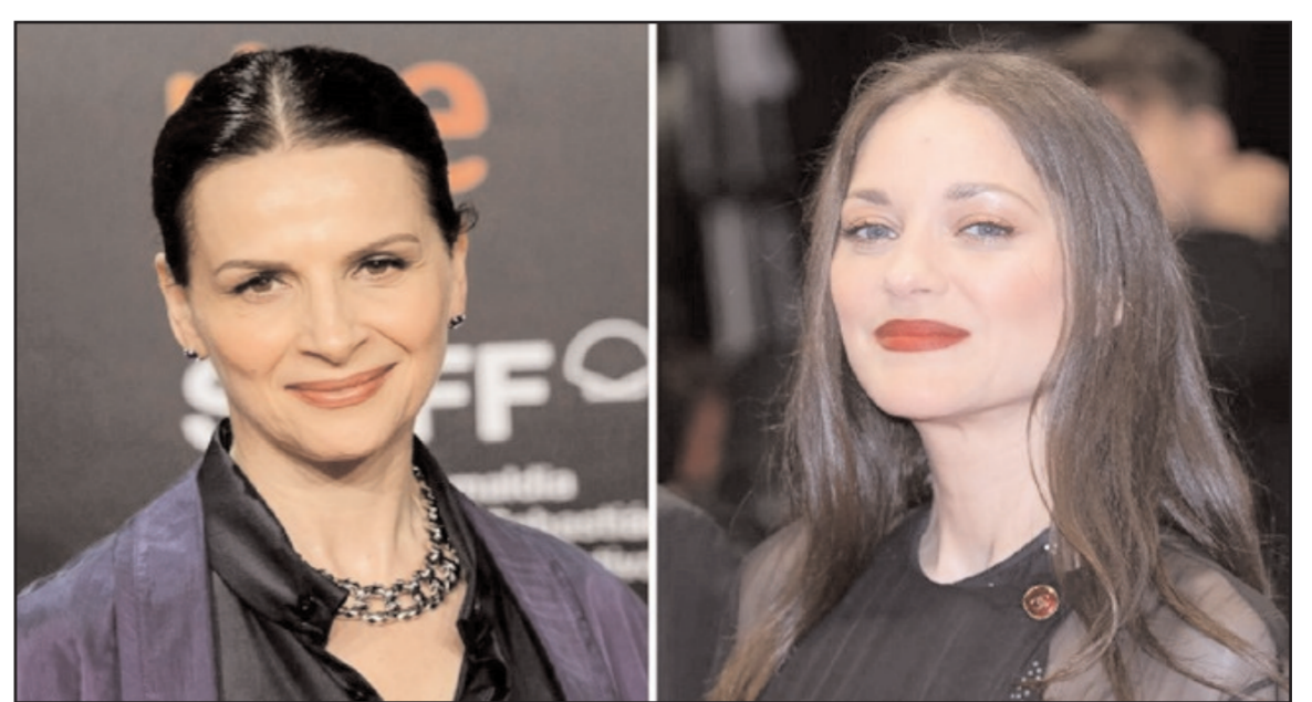
100 से अधिक लोग मारे गए हैं। ईरानी स्कूली छात्राओं और महिलाओं ने अमिनी की मौत के विरोध में अपने हिजाब को हटाकर और रैलियों का आयोजन करके बड़ी संख्या में प्रदर्शन किया है। कई महिलाओं ने सरकार विरोधी नारे लगाते हुए अपने बाल भी कटवा लिए हैं। उल्लेखनीय है कि ईरान में 13 सितंबर को हिजाब न पहनने पर महसा अमीनी को इस्लामी पुलिस ने गिरफ्तार किया था। विरोध करने पर इस्लामी पुलिस ने महसा को इतना पीटा कि इलाज के दौरान उसकी मौत हो गई। इसके बाद पूरे ईरान में हिजाब विरोधी हिंसा भड़क उठी थी। बड़ी संख्या में पुरुषों ने भी महिलाओं के समर्थन में प्रदर्शन किया है। ईरान के

सर्वोच्च नेता खमनेई का भी विरोध किया जा रहा है। इस बीच ईरानी सरकार ने दावा किया है कि हिजाब विरोधी प्रदर्शन के पीछे अमेरिका और इजरायल समेत पश्चिमी देशों का हाथ है। ईरान ने ब्रिटेन के राजदूत को दूसरी बार किया तलब - ईरान ने ब्रिटेन के राजदूत सिमन शेरीक्लिफ को दूसरी बार समन जारी कर हिजाब विरोधी आंदोलन को भड़काने का आरोप लगाया है। यह समन ब्रिटेन के विदेश मंत्री जेम्स क्लॉवर्ली द्वारा ईरानी प्राधिकारियों से शांतिपूर्ण प्रदर्शन का सम्मान करने व गलत तरीके से हिंसा से निपटारे के लिए प्रदर्शनकारियों को छोड़ने के अनुरोध करने के दो दिन बाद आया है।