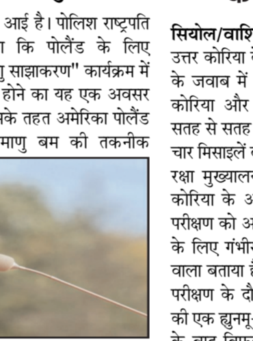
हस्तांतरण के साथ प्रशिक्षण का अवसर दे सकता है। पोलैंड में अमेरिकी परमाणु हथियारों को ले जाना परमाणु अप्रसार संधि और 1997 में नाटो-रूस संस्थापक अधिनियम का उल्लंघन का मामला सामने आ सकता है।

वाशिंगटन/वारसा, (हि.स.)। यूक्रेन और रूस के बीच जारी युद्ध के बीच यूरोपीय देश पोलैंड ने अपनी सुरक्षा के लिए अमेरिका से परमाणु हथियारों की मांग की है। पोलैंड ने आशंका जताई है कि रूस के राष्ट्रपति व्लादिमीर पुतिन यूक्रेन की हमलावर सेना का सफाया करने के लिए परमाणु हथियारों का इस्तेमाल कर सकते हैं। पोलैंड के राष्ट्रपति डुडा की परमाणु हथियारों की मांग इस संकेत का ताजा उदाहरण है कि अमेरिका और उसके सहयोगी युद्ध में परमाणु के उपयोग को रोकना चाहते हैं। डुडा की यह टिप्पणी रूस द्वारा पड़ोसी बेलारूस में परमाणु हथियारों में अनुमति देने के बाद आई है। पोलिश राष्ट्रपति ने कहा कि पोलैंड के लिए "परमाणु साझाकरण" कार्यक्रम में शामिल होने का यह एक अवसर है। जिसके तहत अमेरिका पोलैंड को परमाणु बम की तकनीक के बाद आई है। पोलिश राष्ट्रपति ने कहा कि पोलैंड के लिए "परमाणु साझाकरण" कार्यक्रम में शामिल होने का यह एक अवसर है। जिसके तहत अमेरिका पोलैंड को परमाणु बम की तकनीक